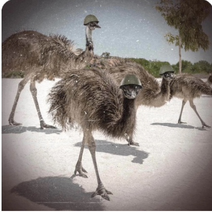
Voorbeeld van emoe propaganda.