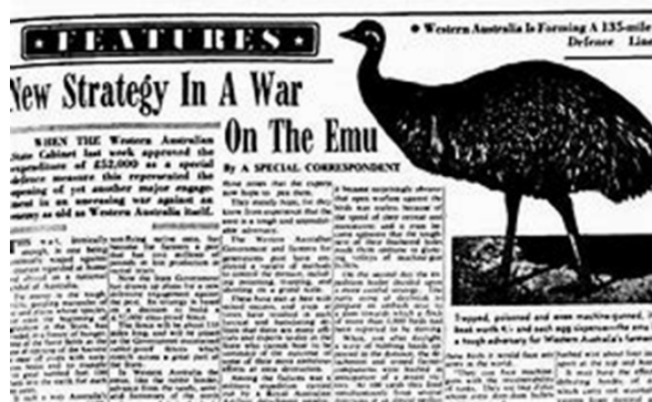
Krantenartikel uit 1932, er moest snel een nieuwe manier komen

Met deze maatregelen konden boeren de dieren beter verjagen en werd de overlast enigszins onder controle gebracht.