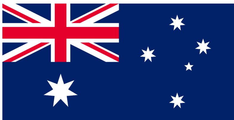
Vlag Australië.

In dit artikel duiken we dieper in dit opmerkelijke en bijna ongelooflijke verhaal.