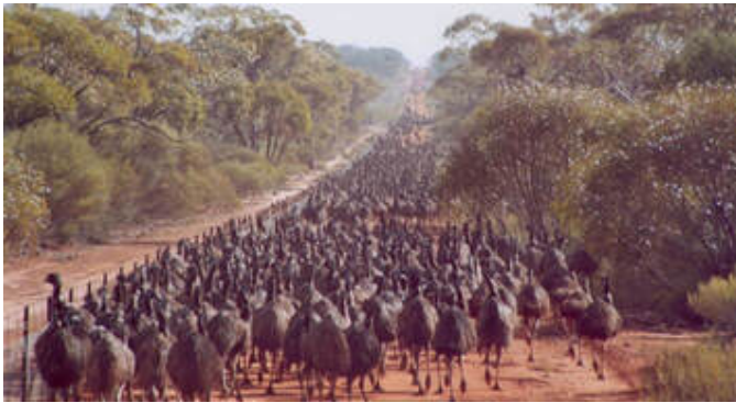
De grote aantallen emoes waar de Australische boeren mee te maken hadden.

Deze "oorlog" duurde tot 10 december 1932 en eindigde na iets meer dan een maand.