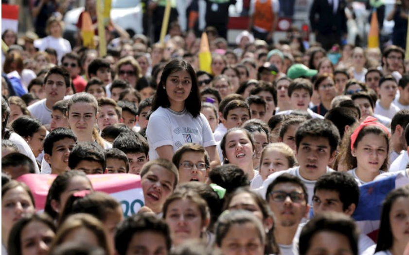
deze foto laat zien dat er veel diversiteit in de Paraguayaanse bevolking zit, van echt wit tot een donkere bruintint.

Rond 1840 werd Paraguay door sommige waarnemers zelfs gezien als een van de meest sociaal egalitaire samenlevingen van het westelijk halfrond — zeker vergeleken met andere landen in Latijns-Amerika, waar koloniale klassenverschillen vaak nog sterk aanwezig waren.