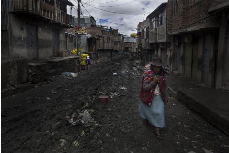
Foto van een van de straten van La Rinconada.

Als ze geen goud vinden, hebben ze in feite een hele maand voor niets gewerkt — zonder inkomen en soms zelfs zonder voldoende eten.