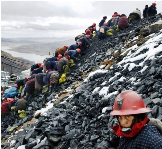
Mijnwerkers worden uitgebuit, maar kunnen op geen wetgeving