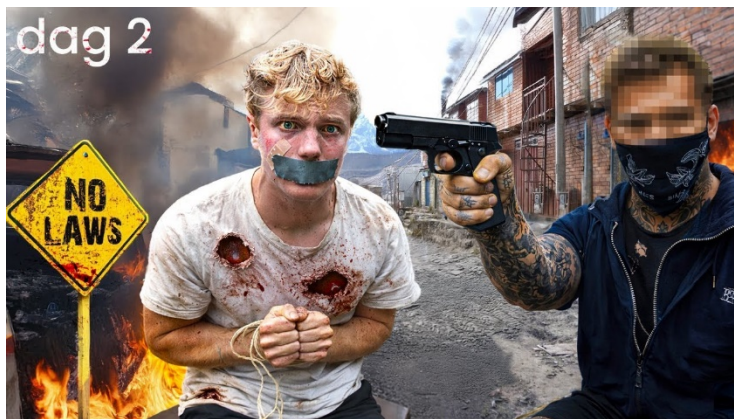
Thumbnail video FrankVD: 3 dagen in een stad zonder wetten (tijdens opname werd er een moord gepleegd).