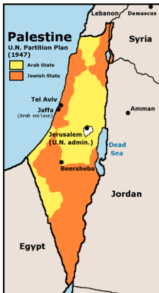
Verdeling Palestina-Israël in 1947.

Omdat Jeruzalem voor beide groepen van grote religieuze en historische betekenis is, zou de stad onder internationaal bestuur komen te staan om conflicten te voorkomen.