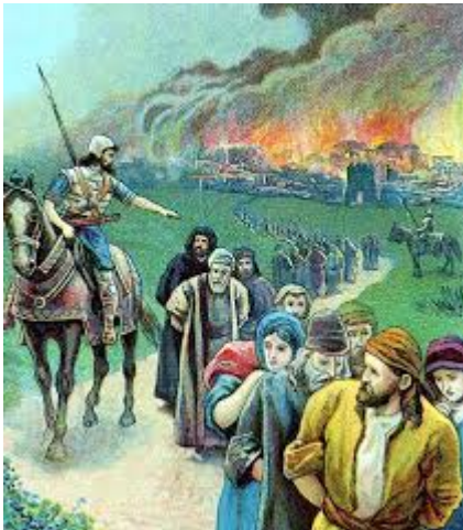
Babylonische Ballingschap in Palestina.

Met deze gebeurtenissen verdween de Filistijnse cultuur geleidelijk uit de geschiedenis, terwijl het gebied zelf onder invloed bleef van verschillende opeenvolgende rijken.