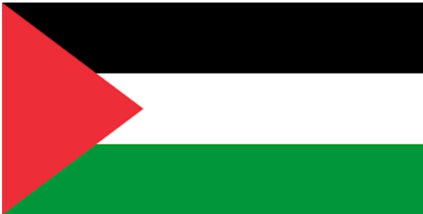
Vlag Palestina.

Op die vragen gaan we in dit artikel dieper in.