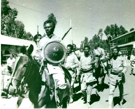
Ethiopische soldaten in 1935 tijdens de Tweede Italiaans-Ethiopische oorlog.

Voor Mussolini ging het echter om meer dan alleen wraak. Hij wilde van Italië een grootmacht maken en droomde ervan om de glorie van het oude Romeinse Rijk te doen herleven. Ethiopië werd gezien als de sleutel tot die ambitie.