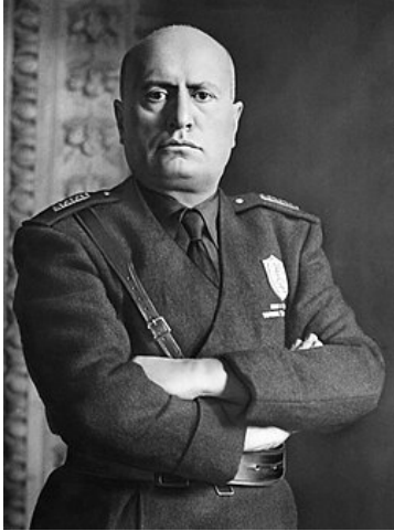
Benito Mussolini.

Het grote verschil tussen de eerste en tweede oorlog lag vooral in de voorbereiding en middelen van Italië. Dit keer stuurde Italië een groot, modern en goed uitgerust leger, met tanks, artillerie en luchtmacht. In tegenstelling tot 1896 was het leger beter georganiseerd en had het een duidelijke strategie.