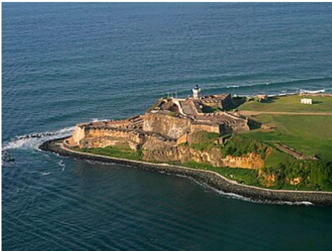
Het grote El Morro fort aan de kust.

Door deze zware verdediging bleef Puerto Rico eeuwenlang een belangrijk en goed beschermd onderdeel van het Spaanse koloniale rijk in Amerika.